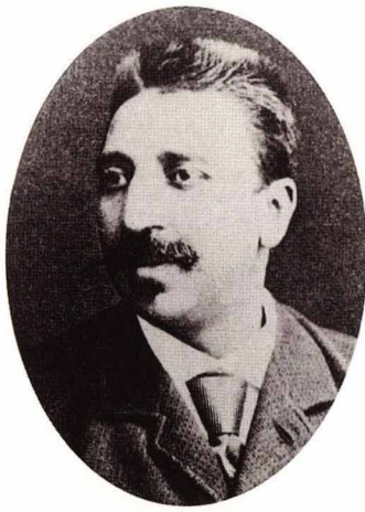
Iacob C. Negruzzi (1842 - 1932)