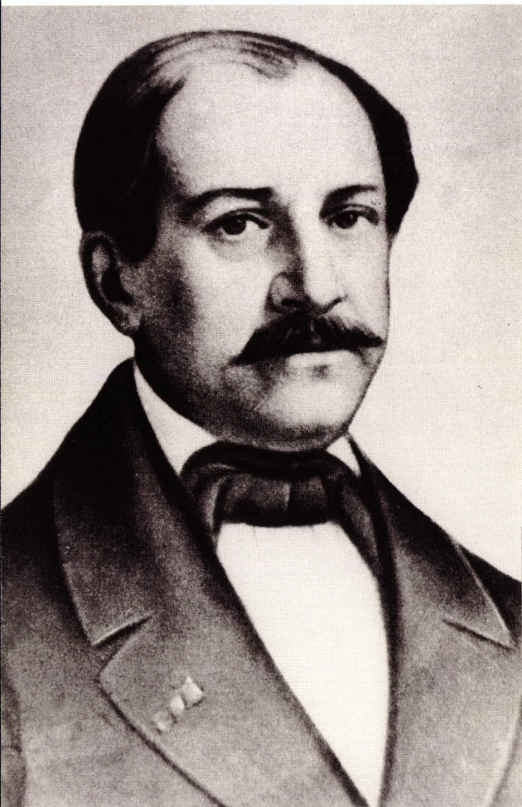
Costache Negruzzi (1808 - 1868)